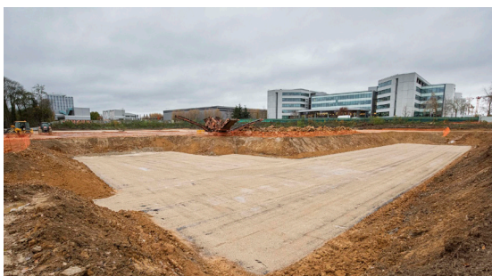
Après abattage des arbres

Le maire sortant affirme vouloir conserver des espaces verts dans notre commune mais il parle en fait des espaces verts propriétés du Département et de la Région. En réalité il a programmé dans le PLU l'abattage des arbres, la disparition des coins de verdure et de beaucoup d'espaces boisés.